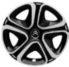
16 Zoll Stahlfelgen STEEL&STYLE