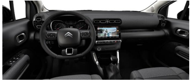
INNENRAUM METROPOLITAN GRAPHITE